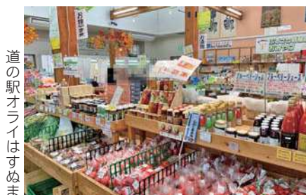
道の駅オライはすめま