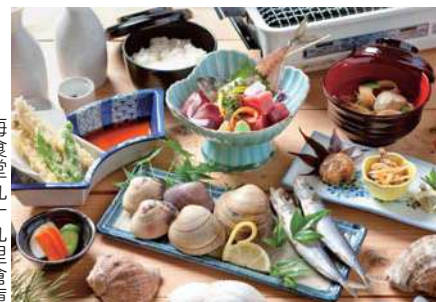
海食堂九十九里倉庫