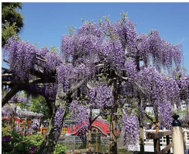
亀戸天神・藤まつり