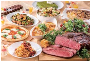
「リラッサ」イメージ