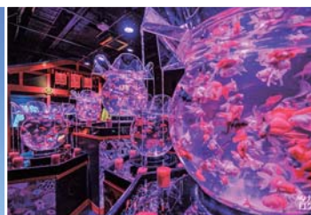
アートアクアリウム