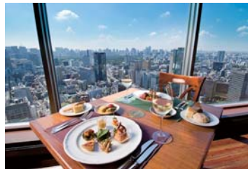
アーティストカフェイメージ