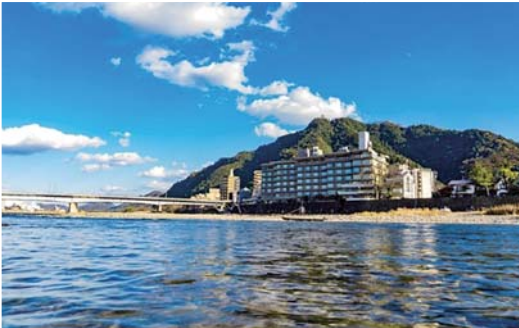
長良川温泉 十八楼