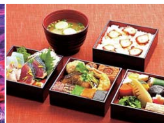
神宮外苑・楠公レストハウス