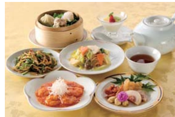
「後樂園飯店」イメージ