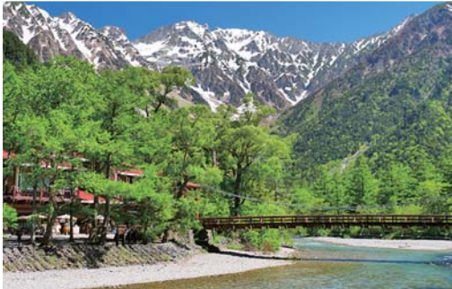
上高地河童橋