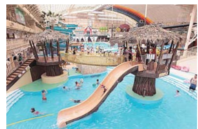
【所在地】福島県いわき市常盤藤原町蕨平50