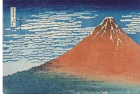
《富士三十六景 凱風快晴》 葛飾北斎 横大判錦絵 江戸時代 天保元~4年(1830~33)頃 大英博物館 1906, 1220, 0.525 ©The Trustees of the British Museum