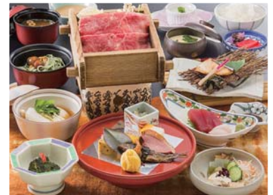
ひだホテルプラザ 夕食イメージ