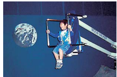
月の重力を疑似体験できる「ムーンウォーカー」