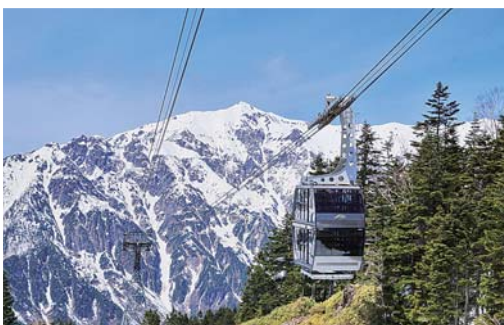
新穂高ロープウェイ