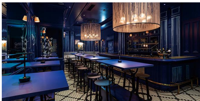
ラブラスリーエリア